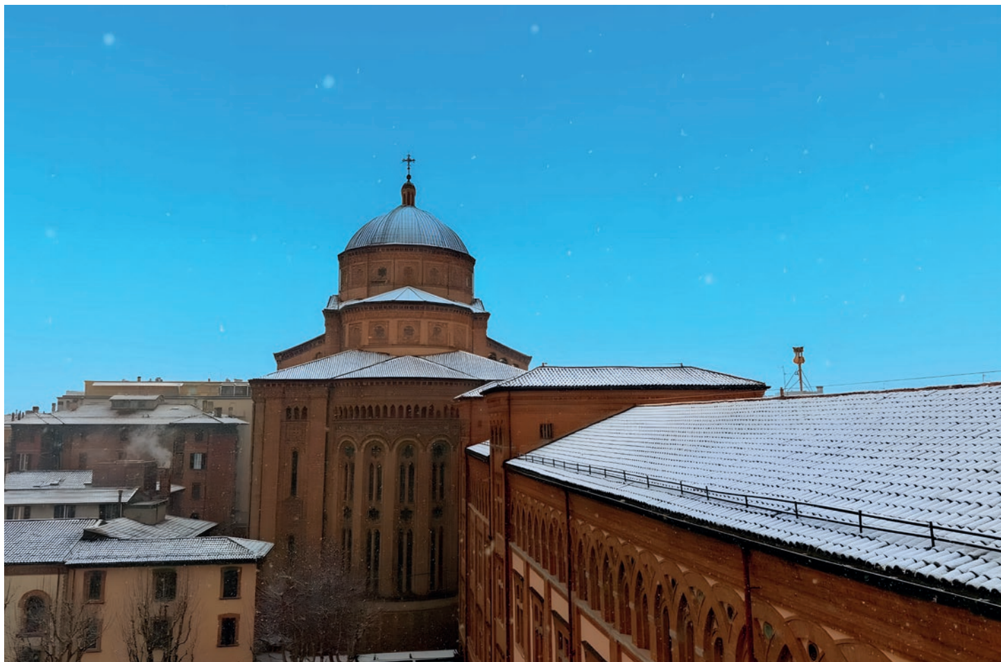
Santuario del Sacro Cuore a Bologna con la neve.

Ho cercato di fare tesoro delle indicazioni datemi dai miei Superiori. Ho voluto mettermi in ascolto delle aspettative di coloro che frequentano la Parrocchia e, naturalmente, della Volontà di Dio!