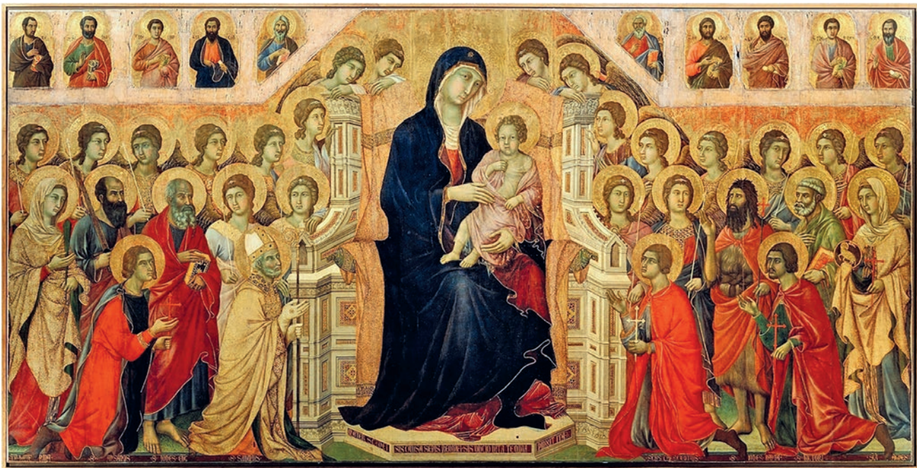
Maestà, Duccio di Buoninsegna.

del Figlio di Dio. Occorre anche aggiungere che fu vera madre di Dio non solo per il fatto di averlo concepito per opera dello Spirito e averlo dato alla luce, ma anche perché, come autentica madre, assunse il compito di collaborare alla crescita umana di suo figlio, in tutte le dimensioni, compresa quella religiosa e spirituale.