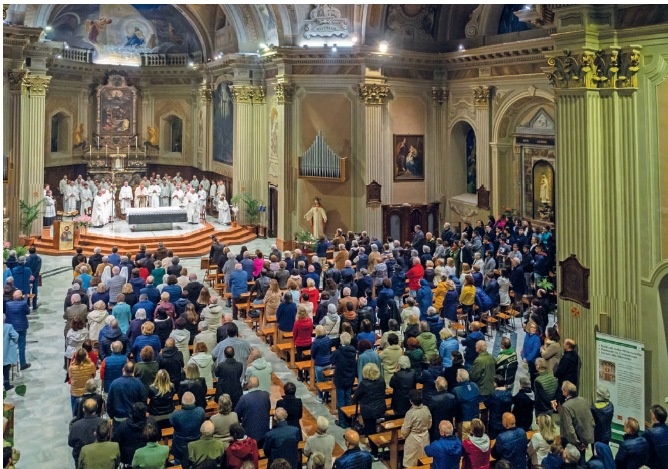
Santuario della SS. Trinità Misericordia, Maccio di Villa Guardia (Como).