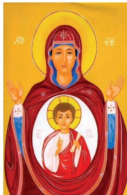
Guerrino Pera, Icona della maternità di Maria

Percorse un lungo cammino di fede e di fiducia in Dio Salvatore, che l'aveva collocata al centro di un mistero che essa non comprendeva, come testimonia esplicitamente e ripetute volte Luca, anzitutto nel racconto dell'annunciazione: "Maria rimase turbata e si domandava che cosa significasse un tale saluto" (1,29), quindi alla nascita di Gesù: "Maria, da parte sua, conservava tutte queste cose meditando in cuor suo" (2,19), poi nel ritrovamento di Gesù tra i dottori nel tempio: "Essi però (Maria e Giuseppe) non compresero ciò che aveva detto loro" (2,50), e finalmente nel sommario che sintetizza il processo di maturazione