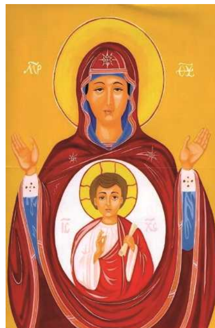
Guerrino Pera, Icona della maternità di Maria

Percorse un lungo cammino di fede e di fiducia in Dio Salvatore, che l'aveva collocata al centro di un mistero che essa non comprendeva, come testimonia esplicitamente e ripetute volte Luca, anzitutto nel racconto dell'annunciazione: "Maria rimase turbata e si domandava che cosa significasse un tale saluto" (1,29), quindi alla nascita di Gesù: "Maria, da parte sua, conservava tutte queste cose meditandole in cuor suo" (2,19), poi nel ritrovamento di Gesù tra i dottori nel tempio: "Essi però (Maria e Giuseppe) non compresero ciò che aveva detto loro" (2,50), e finalmente nel sommario che sintetizza il processo di maturazione